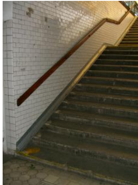
foto 1: Plzeňské hlavní nádraží, kde jsou umístěny žlábků (bohužel jsou úzké, správně je třeba je provést ještě min o 7 cm širší).

V případě nemožnosti napojení na obytnou oblast Žižkova rampami, řešit na schodištích alespoň žlábků podobné těm, na fotografiích níže